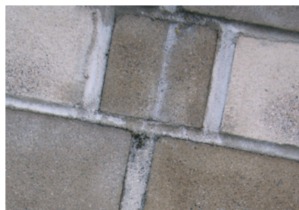
Unbehandelt (nicht gereinigt)

Teile dieser Wand wurden mit Protectosil® SC CONCENTRATE behandelt. Die rechts abgebildete Wand ist unbehandelt. Nach acht Jahren der Bewitterung ist der Unterschied deutlich zu sehen.