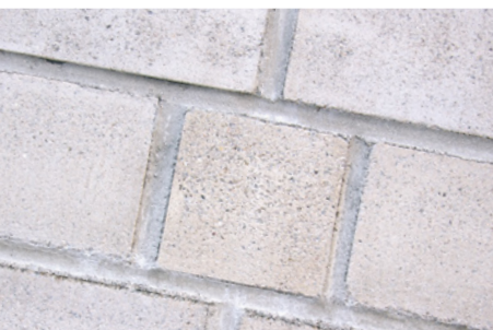
Mit Protectosil® SC CONCENTRATE behandelt (nicht gereinigt)

Protectosil® SC Produktpalette bietet ideale Eigenschaften zum Schutz von porösen Substraten, wie Sandstein und Beton, und ist dabei umweltfreundlich und einfach anzuwenden.